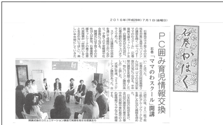
② 2016年7月1日掲載 石巻かほく