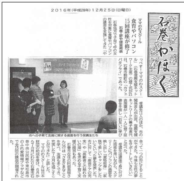
④ 2016年12月25日掲載 石巻かほく