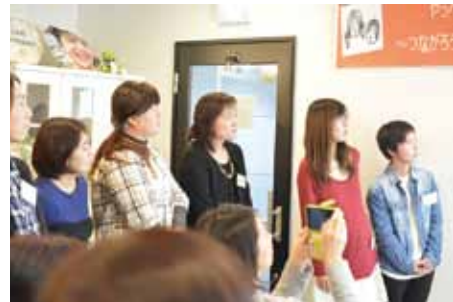
チームB発表の様子