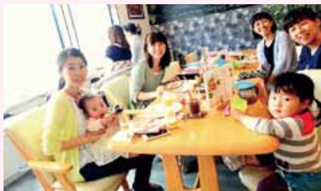
外光が差し込む明るい店内。パソコンワークができるスペースや子どもの遊び場スペースもあります。