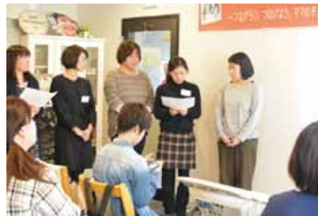
チームA発表の様子

市の乳幼児健診等で利用するのに、駐車場不便&有料→子育て関連で使用するシステムなので割引パスなどがあると嬉しい。