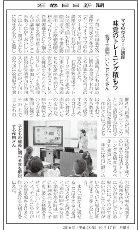
③ 2016年10月17日掲載 石巻日日新聞