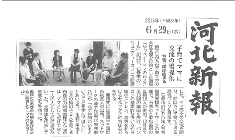
① 2016年6月29日掲載 河北新報

本スクールの様子や成果について、地域のメディアにご紹介いただきました。「河北新報」、「石巻日日新聞」、「石巻かほく」（三陸河北新報社）の三社の皆さま、地域に密着した情報を届ける地域紙ならではの情報発信を、どうもありがとうございました。