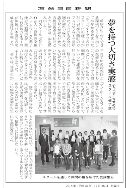
⑤ 2016年12月26日掲載 石巻日日新聞